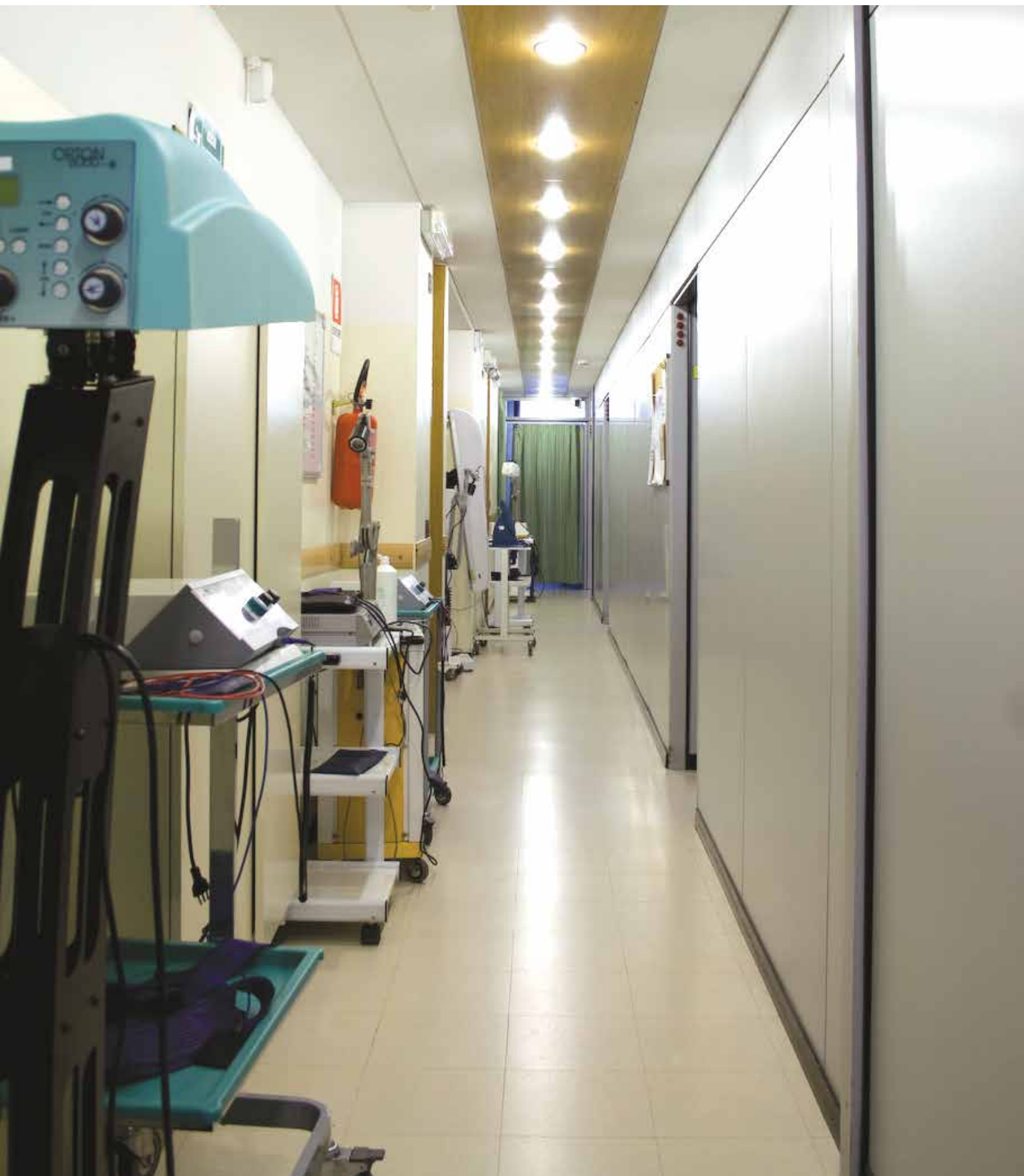
Il reparto di fisioterapia e riabilitazione di Centro Medico Serena.